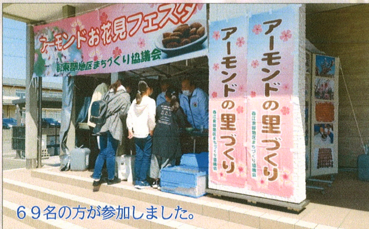
69名の方が参加しました。