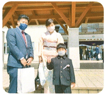
令和4年4月8日（金）春江東小学校