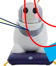
みまもりロボット PaPeRo i