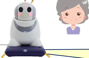
みまもりロボット PaPeRo i