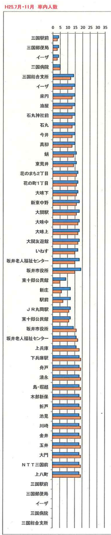
座席 16 立ち 19