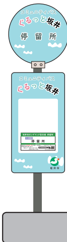
ゴミバス停タイプ