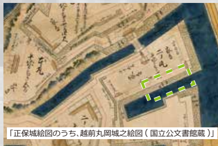
「正保城絵図のうち、越前丸岡城之絵図」