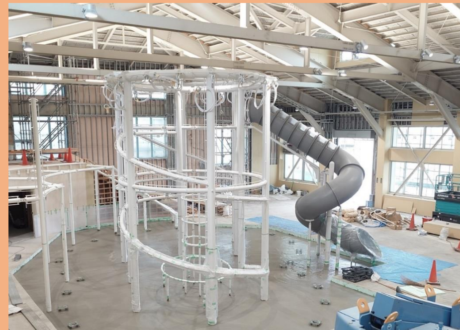
施工状況（竹田山エリア）