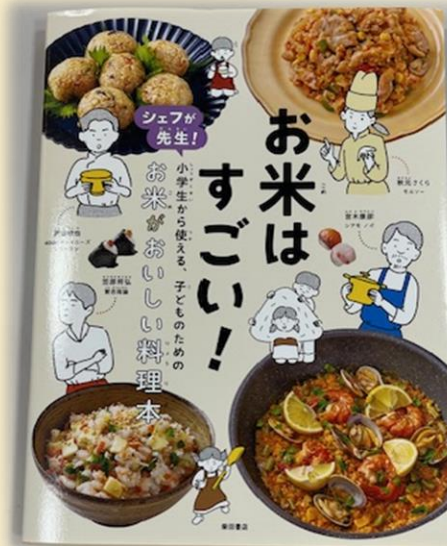
贈呈された料理本