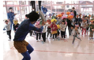
▲園児たちが手作りした鬼のお面をかぶりながら、鬼に豆をぶつけている様子

三国南幼保園で園児42人を対象に、幼年消防クラブ防火豆まきが行われました。毎年恒例となっている豆まき会は、嶺北三国消防署が節分の時期に合わせて、園児たちに防火意識を高めてもらおうと実施。園児たちは「ぼくたち、わたしたちは、火遊びをしません」と声を出して約束し、鬼に扮し火遊びの寸劇を行った消防職員に、元気よく豆を投げていました。