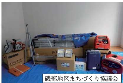
▲エンジンカッター、発電機など防災資機材

自 治総合センターでは、宝くじの社会貢献広報事業として、コミュニティ活動に必要な備品や集会施設の整備などを助成しています。地域社会の発展と住民福祉の向上や安全で活力ある地域づくりに努めています。今回、そのコミュニティ助成を受けて、左表のとおり防災備品が整備されました。この整備により地域防災力の向上と、防災訓練などへの活用によりコミュニティ活動を活性化させることができます。