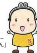
坂井市消費者センター マスコットキャラクター 「しっかりさん」