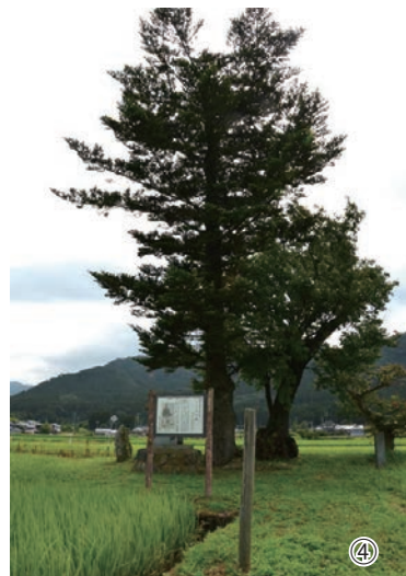
①女形谷のサクラ・てんのう堂位置図 ②「女形谷のサクラ」福井県指定文化財 ③昨年9月に実施した支柱の取り替え作業 ④「てんのう堂」坂井市登録文化財