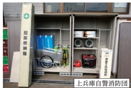
▲発電機、投光器などの防災資機材