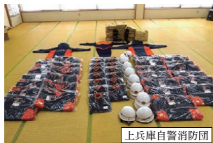
▲自警消防団の制服やヘルメットなど