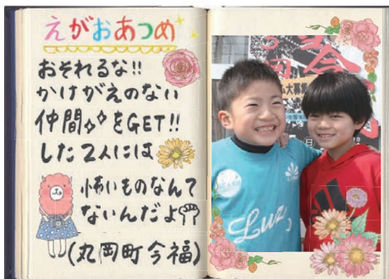
※今回は、なんちゃって雪合戦に行ってきたよ!

区内には、「てんのう堂」(市登録文化財)と呼ばれる、後の継体天皇と古代豪族の相伴金村が見えたと伝わる場所にも桜があり、両木とも区民の努力によって、4月には綺麗な桜の花が咲き、訪れた人の心を和やかにすることでしょう。