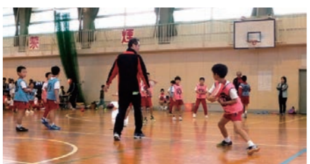
▲試合でディスクを素早く投げる児童(2017年10月 春江子どもディスクドッチ)

ドッチボールとはほぼ同様のルールで、ボールの代わりにウレタンとナイロンを使用した、柔らかいディスク(ドッチビー)を使用します。軽くてあたっても痛くないので安全で、年齢や性別に関係なく多くの方が一緒に楽しめます。 種別 ディスクドッチ 小学生(低学年)の部 小学生(高学年)の部 一般(オープン)の部 いずれも、ベンチに入れる人数は17人以内です。1チーム、小学生の部は13人、一般の部は10人でゲームを行います。 家族や友達、仲間と一緒に楽しく参加しましょう。