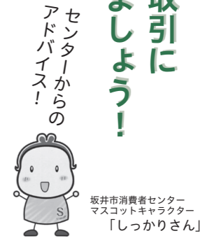
坂井市消費者センター マスコットキャラクター 「しっかりさん」