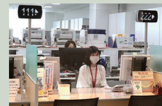
▲市民生活課窓口。モニターにて案内があるまでは、待合スペースでお待ちください