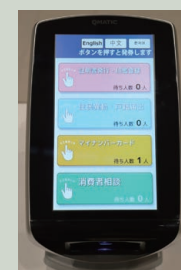
◀番号発券機。発券する際に、待ち人数の確認ができます。英語・中国語・韓国語にも対応