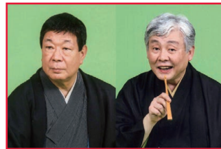
▲古典落語の名手と新作落語のエースの競演をお楽しみください!