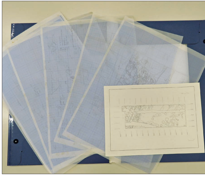
▲調査過程で作成した図面と掲載用に処理した図面