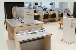
▲記載台には、各種申請書が備え付けられています