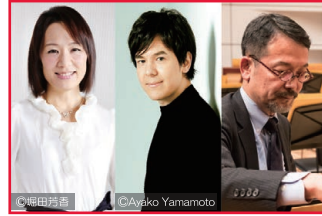
▲作家×ピアニスト×調律師による トーク&ピアノコンサート!