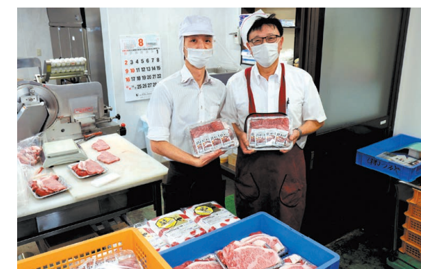
▲故郷を離れて頑張る学生さんを応援したい一心で作ったという、(株)つるやの若狭牛ステーキセット