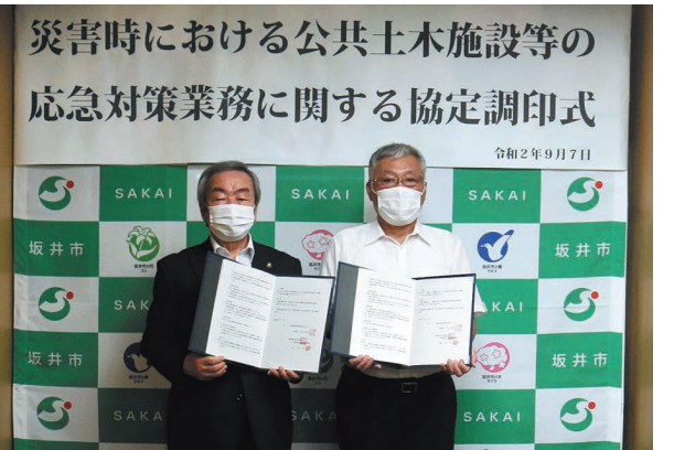
▲協定書に調印を行った寛会長(右)と坂本市長

まちの話題が満載の「フォーカス」は、市のホームページ(☎ https://www.city.fukui-sakai.lg.jp/ )からもご覧いただけます。ホームページでは“ホット”な話題を随時公開。また、上記以外の話題も紹介しています。