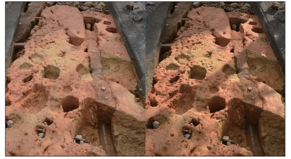
▲影が濃すぎる例(右)と、曇り始めて影が薄くなった例(左)。左の方が見やすいことがわかる