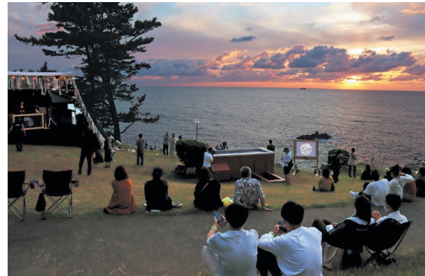
▲心地よい音楽に身をゆだねながら、東尋坊から息をのむほど美しい景色を味わう来場者たち

東尋坊を望む特設会場で、音楽フェスティバル「東尋坊SUNSET2020」が開催されました。唯一無二の美しい夕陽を眺めるだけでなく、音楽とともに東尋坊の魅力を感じてもらおうと、(一社)DMOさかい観光局などで構成された実行委員会が実施。期間中1,200人が訪れ、陽が沈むにつれ表情を変える絶景と音楽のコラボレーションに心奪われていました。