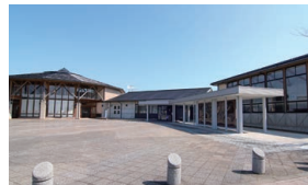
▲総合開会式会場のいねす