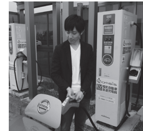
▲市内に設置されている、電気自動車用急速充電器

二酸化炭素を排出しない、地球にやさしい移動手段の電気自動車に普及させるために、充電器の補助をしますよ!