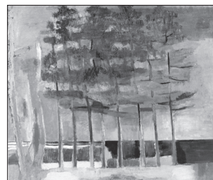
▲松(1960年、日本芸術院賞受賞作品)

※入館は16時30分まで ※毎週水曜日休館 みくに龍翔館 入館料 一般 300円 小中学生 150円 ※市内小中学生は無料