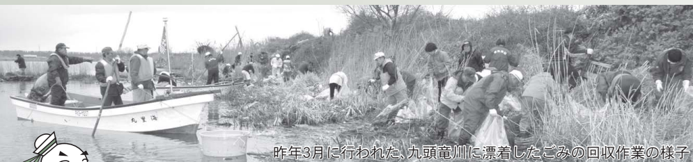
昨年3月に行われた、九頭竜川に漂着したごみの回収作業の様子