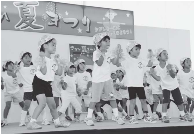
▲元気いっぱい！Kagashiダンサーのステージ