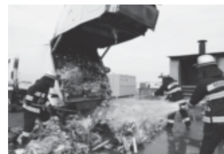
▲収集車内でごみが爆発。危うく大事故に

6 月4日(水)8時40分ごろ、三国町木部地区において、ごみ収集時に、走行中の収集車の荷台から発火する事故が発生しました。