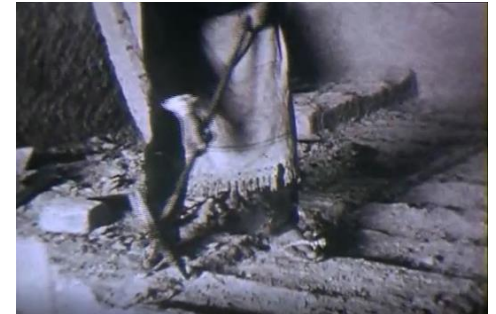
石切り場での石切作業