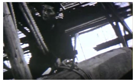
木材の取り外し作業