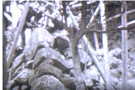
石垣の積み直し作業