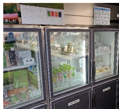
AZLM CONNECTED CAFE 渋谷地下街店での展示イメージ図

今回店舗では「ふるさとチョイス 電子感謝券」を利用することも可能です。一部の品を対象に、電子感謝券を活用するとその場でお礼の品を持ち帰ることができます。