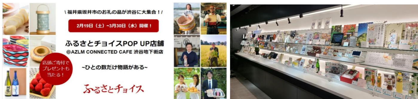
AZLM CONNECTED CAFE 渋谷地下街店での展示イメージ図

なお、企画概要や電子感謝券に関する詳細は別添の株式会社トラストバンクの報道発表資料をご確認下さい。