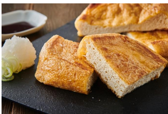
有限会社谷口屋(丸岡町)の「おあげ」