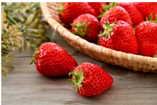
ICHIGO OJI(春江町)の「朝摘みイチゴ」

「ふるさとチョイス POP UP 店舗」では、「ひとの数だけ物語がある」をテーマに、坂井市ふるさと納税で人気の返礼品を46点(26事業者)展示します。品とともに、事業者や生産者が返礼品に込める熱い想いや、モノづくりのこだわりなどを紹介します。この店舗では、東京にしながら、坂井市産品の実物を見ることができ、また生産者の想いに触れることができ、株式会社テトテラ(春江町)の平飼い福地鶏「ふくたまごマヨネーズ」や近ちゃんふあ〜む(三国町)の完熟すりおろし「美梨ジュース」、有限会社さんさん池見(三国町)の「いちほまれ」真空パックなどが並びます。なお、展示品の中から、ICHIGO OJI(春江町)の「朝摘みイチゴ(※)」と有限会社谷口屋(丸岡町)の「おあげ」などの試食を実施します。(実施がない場合もございます)