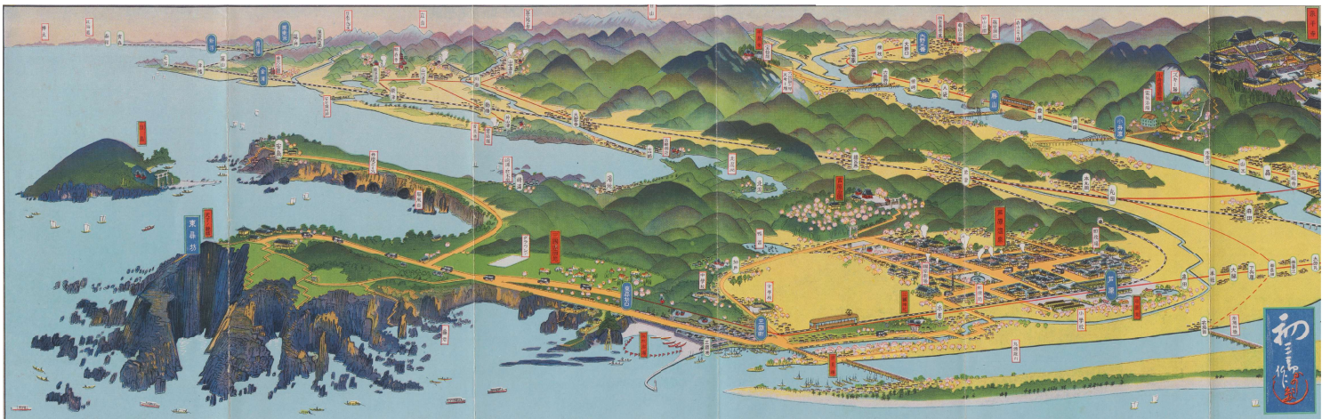
越前電気鉄道三国芦原電鉄沿線案内