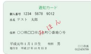
(表面) 通知カード (裏面)