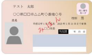
(表面) 個人番号カード (裏面)