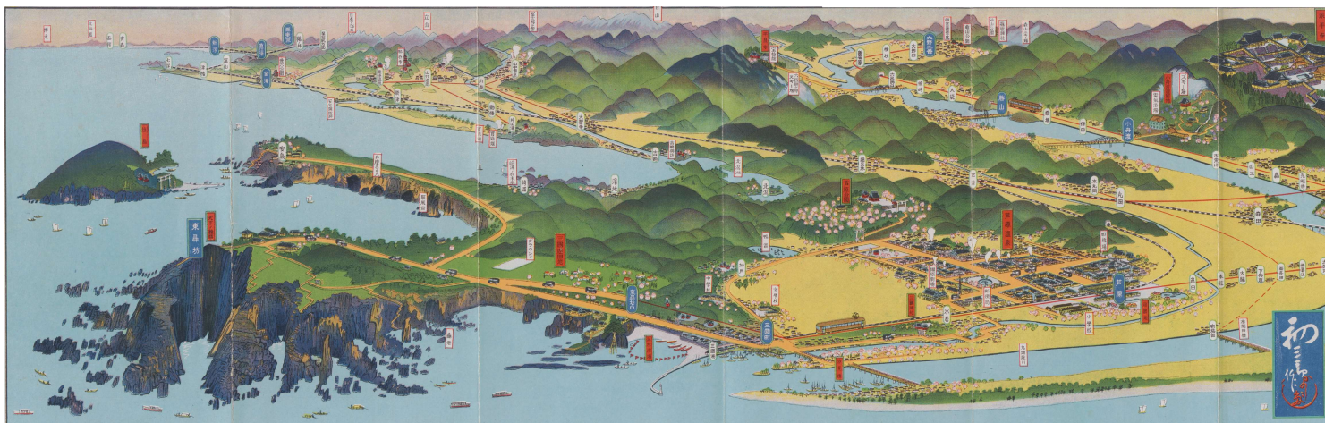
越前電気鉄道三国芦原電鉄沿線案内 (国際日本文化研究センター所蔵)