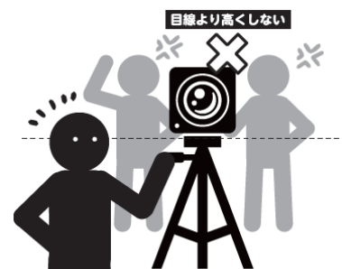
撮影用三脚の注意

特に階段席では、三脚が後方の視界を遮ったり、指定範囲を超えてスペースを占有したりすることで、毎年トラブルが発生しています。他のお客様のご迷惑となる行為や、係員の指示に従っていただけない場合は、退場していただくこともございます。ご自身の席の範囲内で、周囲に配慮したご利用をお願いいたします。