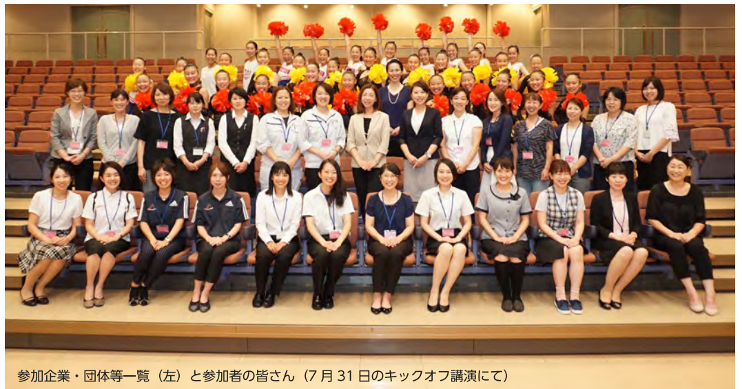
参加企業・団体等一覧(左)と参加者の皆さん(7月31日のキックオフ講演にて)