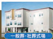
一般葬・社葬式場