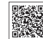
健康さかい大作戦

健康づくりや生活習慣病予防のためには塩分のとりすぎ、運動不足、野菜摂取不足に気を付けなければなりません。市では、健康で明るく豊かな生活を送るために毎日の暮らしの中で取り組める3つの取り組み(健康行動指針)を推進しています。