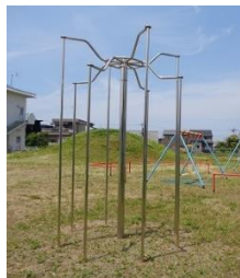
園庭にある様々な遊具