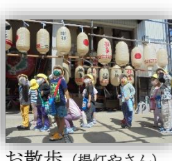
お散歩（提灯やさん）