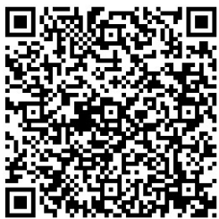
お困りごと相談窓口 (坂井市ホームページ)

福祉に関するお困りごとの解決に向けて、たくさんの相談先があります。坂井市ホームページにも詳しくご紹介しているので、 「坂井市 ここサポ」 で検索 または、下のQRコードからご覧ください。 相談先が分からない福祉のご相談は、「ここサポ」がお力になります。