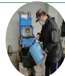
ホタルの幼虫飼育装置