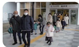
福井駅へ到着 えちぜん鉄道の駅も綺麗になっていました。

今回は東部地区の皆さんと合同で開催した「えちぜん鉄道に乗ろう事業」では三国駅から乗車し、福井駅着。えちぜん鉄道の駅はとっても綺麗になり、福井が誇る恐竜がお出迎えしてくれます。駅から歩いてすぐのハピリン5階、セーレンプラネットでプラネタリウムを満喫しました。大迫力の星空に感動して心地よいリラクゼーションを味わうことができました。