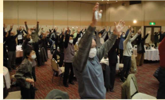
▲体をいっぱい動かしました。