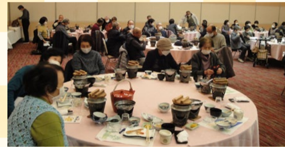
▲美味しい食事で満腹になりました。