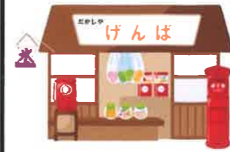
(※画像はイメージです。)

「ガバ」「長谷川」「木下」「つばきや」「庄五郎」、それに駄菓子屋。名前は何やったかの…ほや、「げんば」や!(ほやがし!)