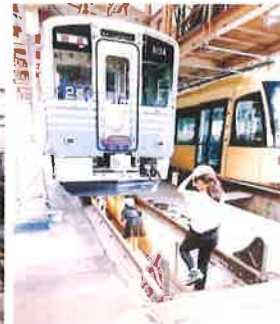
隣にはki-bo(キーボ)の姿が!