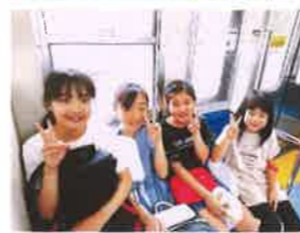
えち鉄三国駅出発!