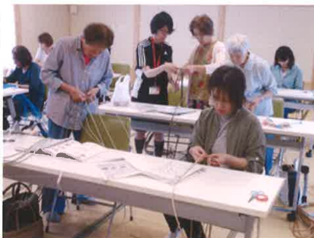
どんな作品に仕上がるか楽しみやの～

まず、バッグの縦・横・高さに合わせてテープを切って、その後、6本幅に一拳に割くんやけど、テープが長いからこれが結構大変なんやぞ。テープの用意が出来たらバッグの底作りから。最初に底の中心を作って横に1列編んでくんや。それから上下に編み足していくんやけど、文字ではなかなか上手く伝わらんやろの。(苦笑)