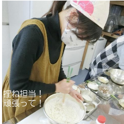
丸く、薄く伸ばすのは結構難しい。

好評により、第二回「マクロビごはん」講座を開催しました。今回は旬の冬野菜をふんだんに使いとても美味しく、体に良いお料理が作れました。皮から作った餃子のモチモチ触感が最高！