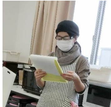
マクロビの講義を聞きます。一物全体・陰陽調和。ためになります。