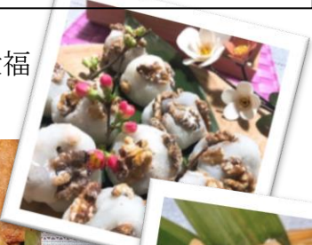
もちもち稲荷寿司