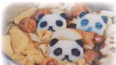
おでんの具にしても...