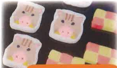
今年の干支 いのしし