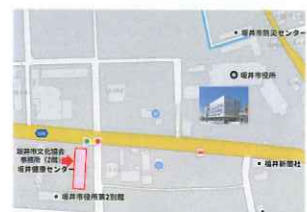
【坂井健康センター】