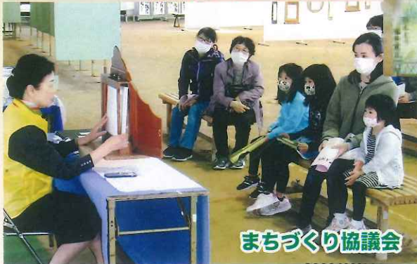
まちづくり協議会