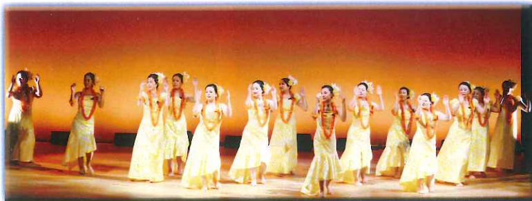
オハナ フラ カイマリーノ