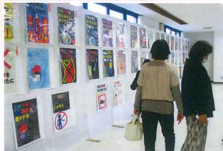
防災ポスター展示