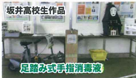
足踏み式手指消毒液