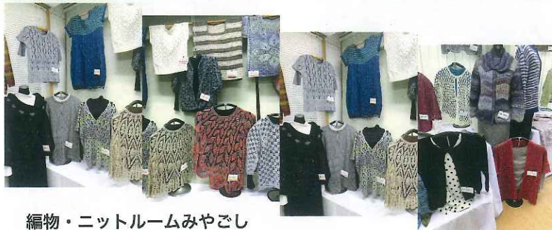
編物・ニットルームみやごし