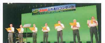
男声歌仲間 キャッスル