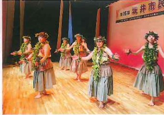
三国支部 オハナフラ カイマリーン