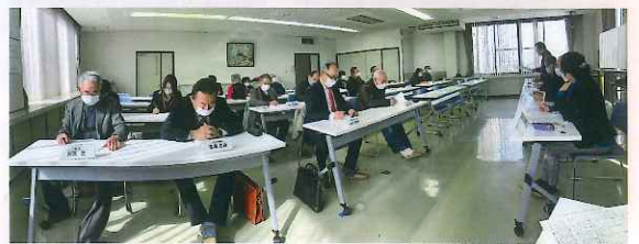
文化祭実行委員会（総括）風景 コロナ禍での活動報告が各支部長より発表されました