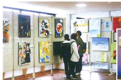
児童絵画展示風景