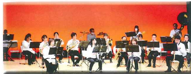
三国シンフォニックウインズ