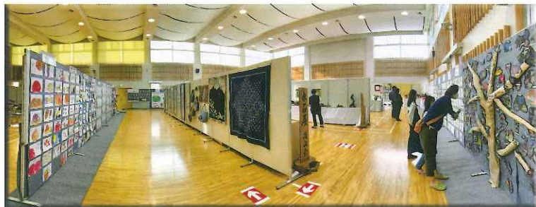
展示会場は → 一方通行でコロナ対策