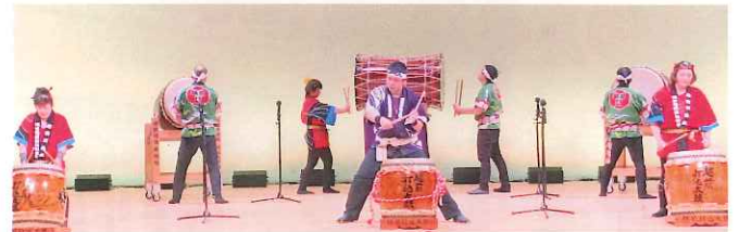
郷土芸能祭：越前打込み太鼓