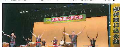
御神鹿打込み太鼓