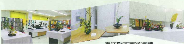
春江町茶華道連盟