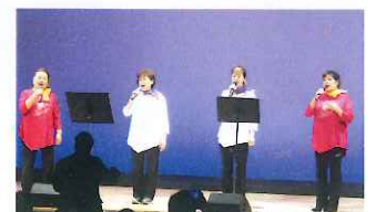
おたまじゃくしの会

本年度春よりコロナ感染拡大防止対策で支部総会や市協会総会が中止され、六月より活動が開始となり十一月の市文化祭実施が決定された。文化祭に向けて活動する展示、芸能、部会員出演者の懸命な姿が頼もしく、文化祭が事故感染拡大もなく成功裡に終わることが出来、最大の感謝である。感染第二波の報道にて、秋の研修会と新年の集いの中止に残念な思いがある。次年度へのエネルギー発揮としたい。