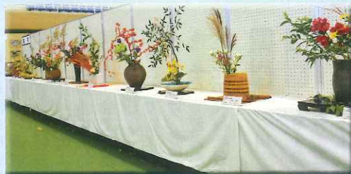
華道（文房流・池坊・MOA）