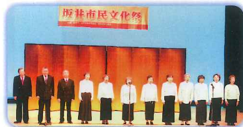
佳朋会・湊風吟詩会