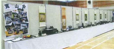
越前水石寛山会・尚山会