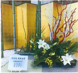
生花大作 坂井支部 伊藤紅夢社中