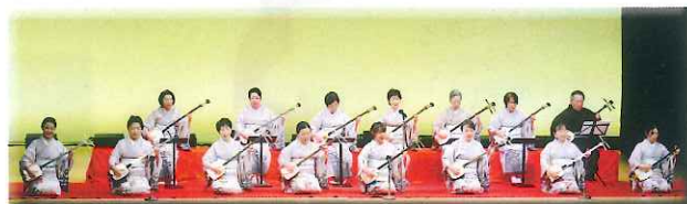
竹世志会・江戸小唄会