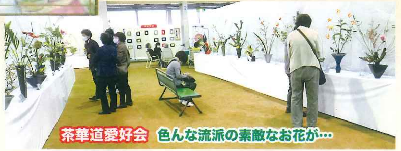
茶華道愛好会 色んな流派の素敵なお花が...