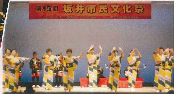
丸岡おじゃれ保存会