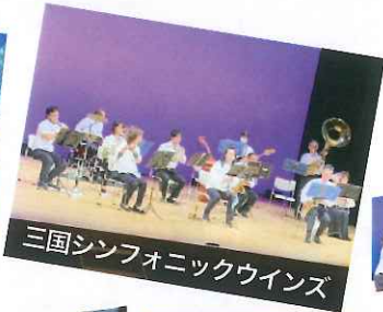
三国シンフォニックウインズ