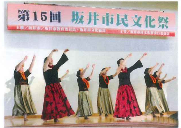
フクイアロハレイフラスタジオ春江