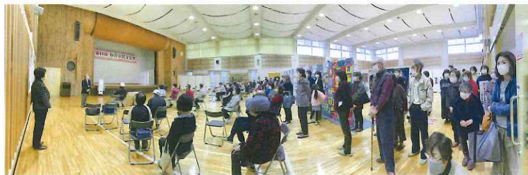
文化祭閉会式の様子