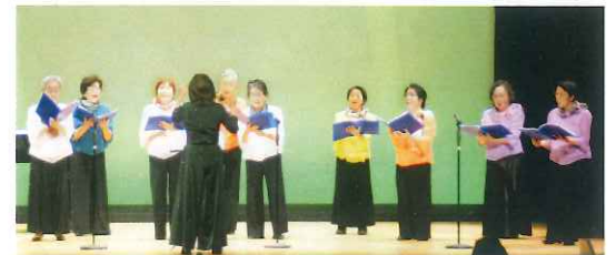
まるおかローレル