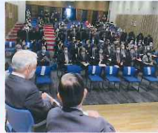
入場を制限しての 総合開会式典