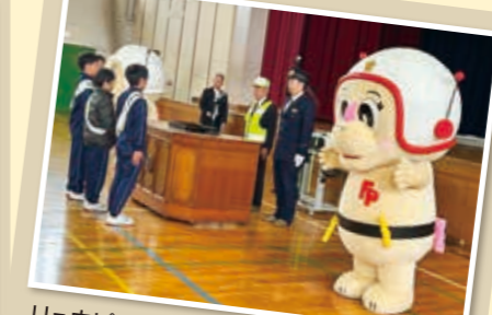
リュウピー・リュミー交通保安官任命式