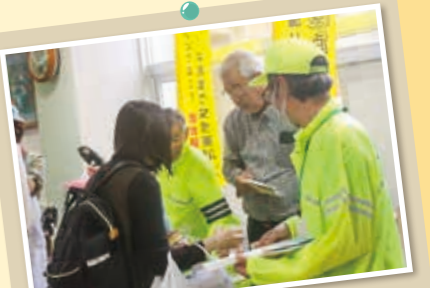
木部秋のふれあいまつり