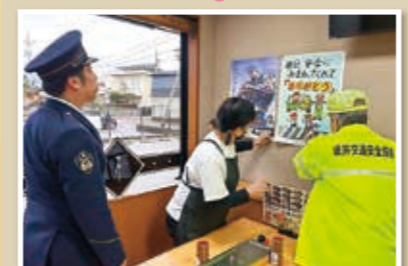
飲酒運転撲滅運動