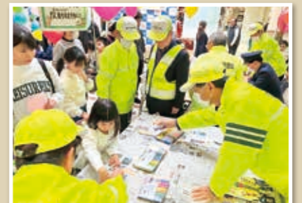
わくわくさかい安全安心フェスタ