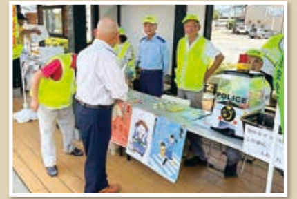
高嶺ふれあいまつり