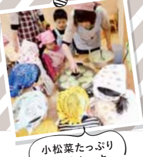
小松菜たっぷり ホットケーキ