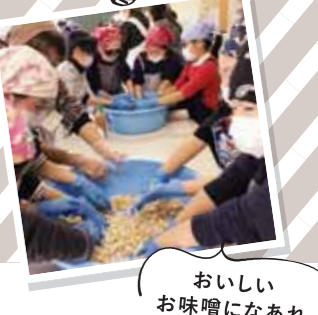
おいしい お味噌になあれ