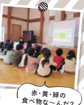
赤・黄・緑の 食べ物な～んだ？