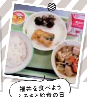
福井を食べよう ふるさと給食の日