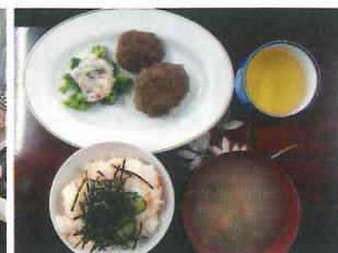
本日の献立 ますの寿司 レンコン入りつくね ブロッコリーのかにあんかけ サイコロ野菜スープ