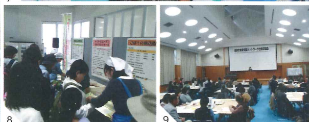
1.兵庫そば打ち体験会(兵庫コミュニティセンター) 2.男の料理教室(まないた会) 3.栗拾い(雄島こども園) 4.流しそうめん(わかか保育園) 5.料理教室(みくに未来保育園) 6.炊き出し訓練(坂井市赤十字奉仕団) 7.笹もち作り(木部小学校) 8.野菜摂取促進イベント(食生活改善推進委員会) 9.全体交流会(坂井市食育市民ネットワーク)