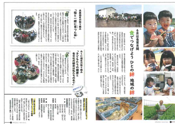
令和元年広報さかい6月号