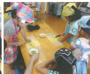
みそ汁の材料(ねぎ)切り