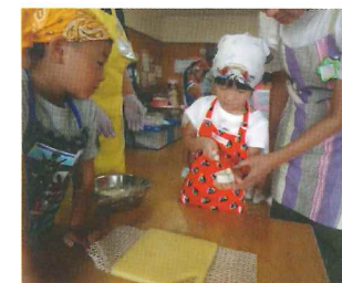
みそ汁の材料(豆腐)切り