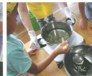
みそ汁のだしとり