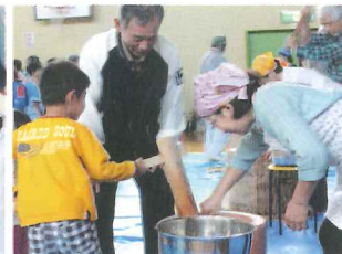
餅つき(秋のふれあいまつり)