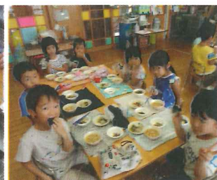
みんなでいただきます