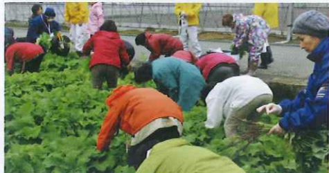
収穫体験と料理講習