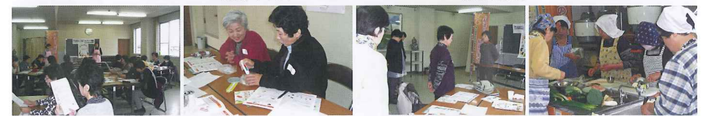
生活習慣病予防教室