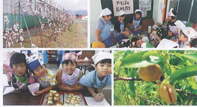
アーモンドの里づくり事業