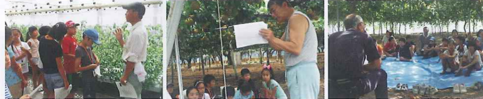
県立園芸カレッジ見学