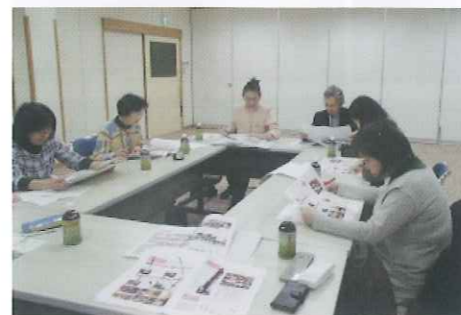
ネットワーク広報部会の様子

坂井市の広報誌「広報さかい」6月号に、ネットワーク通信を掲載し、食育の大切さを広く市民のみなさんに周知しました。テーマは「食から始めよう 健康づくり」。生涯にわたって健康な体をつくるためにプラスマイナスチャレンジ(+野菜、-塩分)を特集しました。食育ネットワーク通信は坂井市ホームページでご覧になれます。