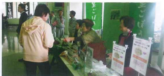
イベントでの模擬店(ゆりの里公園)

私たちのグループでは、伝統の福井野菜「越前白茎ごぼう」の継承と普及活動を行っています。この野菜を学校給食で使ってもらうことや、小学校での栽培、収穫、料理教室に出向くなど、地産地消と食育を進めています。また、市で開催されるイベント等に参加し、炊き込みごはんやロールサンドなどを作ってPRをしています。