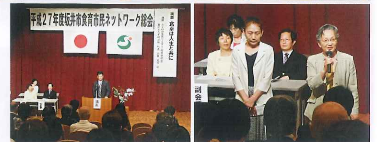
新役員が承認されました