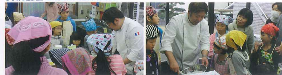
学校給食アドバイザー活動