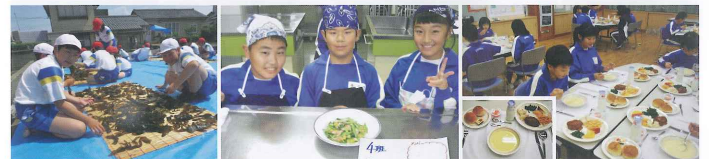
5年 わかめ干し 安島の漁港で、海女さんが収穫したわかめを干しました。このわかめも、給食のわかめご飯で登場しました。