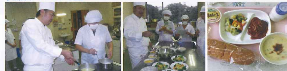
学校給食メニューの開発