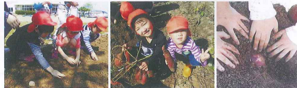
じゃがいもの植えつけ

近隣の老人介護施設では、さつまいもの苗植えやいも掘りなどを体験させてもらい地域との交流の中で食育の楽しさを学んでいます。