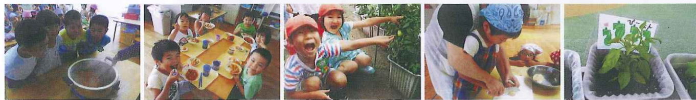
クッキングカレー