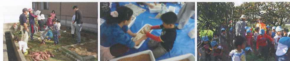
放課後子ども教室「エコファーム」