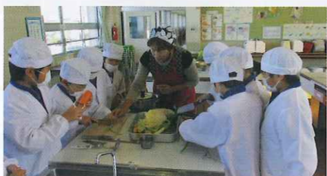
小学校での料理教室