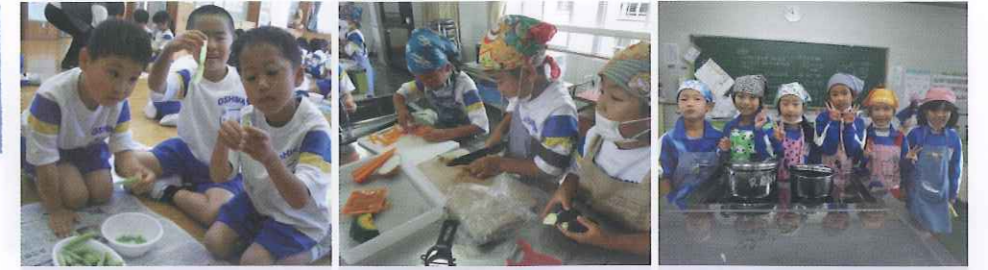
1年 えんどう豆のさやむき 給食のえんどう豆ご飯に使用しました。