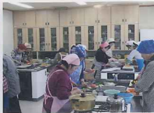
生活習慣病予防教室