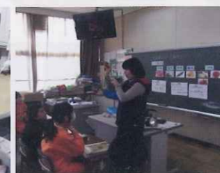
5年 だしについて知ろう