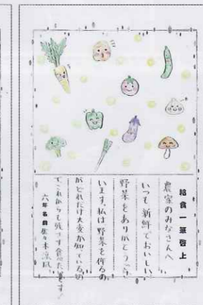
(右) 給食キャラクター作り

みんなが大好きな「きな粉揚げパン」と「ソースかつ丼」をモチーフにしたキャラクター。たくさんの応募の中から選ばれた名前は「あげパンマン」と「A養子」です。