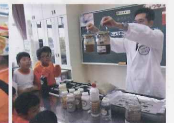
3年 しょうゆ教室、豆腐団子づくり