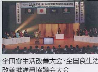
全国食生活改善大会・全国食生活改善推進員協議会大会 平成26年度は福井県で開催。