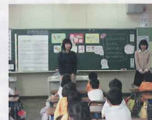
1年 さつまいもパワーを調べよう