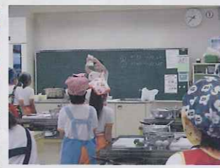
小学校出前料理教室