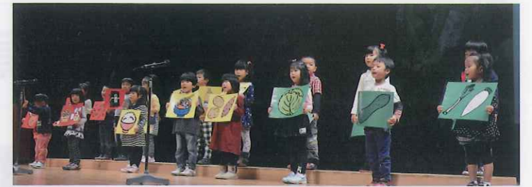
健康都市宣言式典発表

つくる～たべるまで、一連の流れで年間を通して様々な食育活動を行っています。また、三色板を使ったり、栄養の歌を歌ったり、遊びの中で栄養を学んでいます。