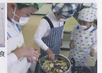
あおぞら、そよがぜ さつまいもを使った料理