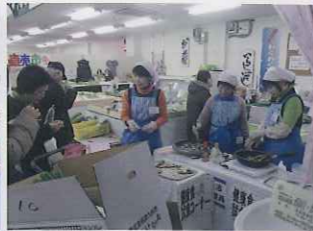
野菜たっぷり食べよう運動