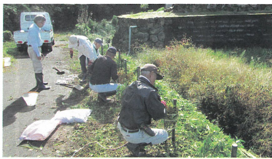
地域での植樹活動（南越前町）