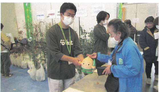
緑化苗木の配布（敦賀市）