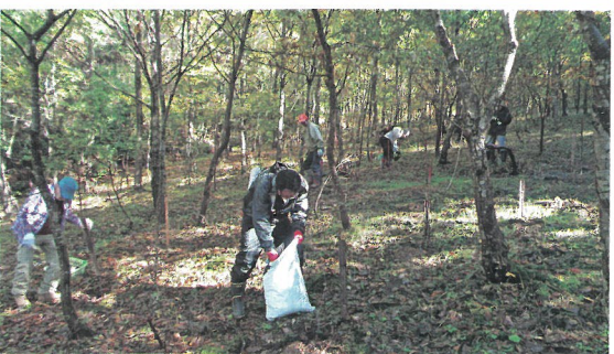
ボランティアによる森づくり活動（永平寺町）