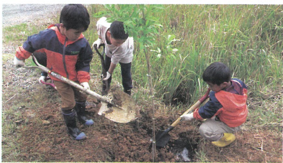
子ども達の森林学習（若狭町）