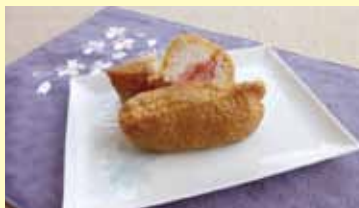
ハチミツ入り赤梅酢に漬けたらっきょう使用（南出アレンジ）

「らっきょう」は、明治初期から栽培が始まりました。三年子らっきょうは、植付から収穫まで足かけ3年をかけて栽培します。小粒で純白、繊維が細かく巻もしっかりし、歯切れがいいのが特徴です。今回は、らっきょうの甘酢漬を使い、いなり寿司を作りました。