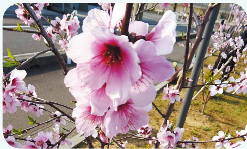
バラ科サクラ属のアーモンドの花、果実は7～8月頃