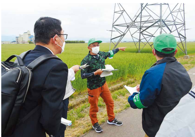
現地確認の様子（R 4年4月）

農業委員会は、「農業委員会等に関する法律」に基づいて市町村に設置が義務付けられている行政委員会です。毎月の農業委員会総会においては、農地法に関する申請の審議などを行っています。また農地利用最適化推進委員と協力し、農地パトロールなども行っています。