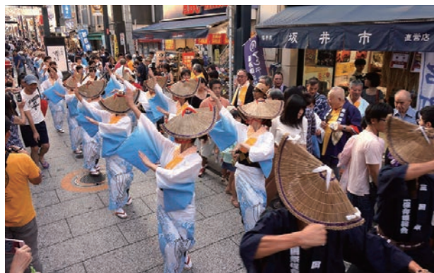
▲三味線や笛に合わせて、商店街をゆったりと踊り歩きながら三国湊の伝統文化を存分に披露した参加者

坂井市アンテナショップのある品川区・戸越銀座商店街で、三国の夏の風物詩「三国湊 帯のまち流し」を初披露しました。地元・三国の踊り手など約40人、同商店街から有志17人が連れに参加したほか、市内の小中学生が「子ども記者」として東京での歓迎ぶり取材。伝統文化を次世代につなぐ場になるなど、さまざまな交流や誇りが生まれていました。