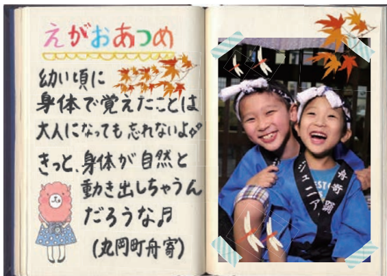
※福井県指定無形民俗文化財「舟寄踊」に行ってきたよ♪

地 域には、さまざまな歴史文化があります。地域の宝である歴史文化を地域で工夫して後世に伝えてみてはいかがでしょうか。