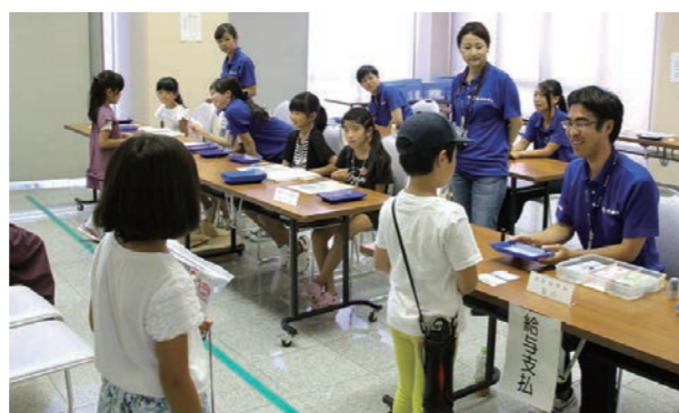
▲銀行に預けると利息がつくほか、給料には税金がかかるなど、本格的にお金の流れを学ぶ子どもら