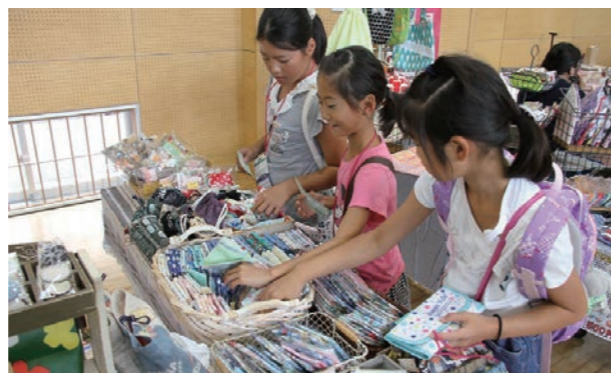
▲働くことで得たお金で、買い物を楽しむ子どもら