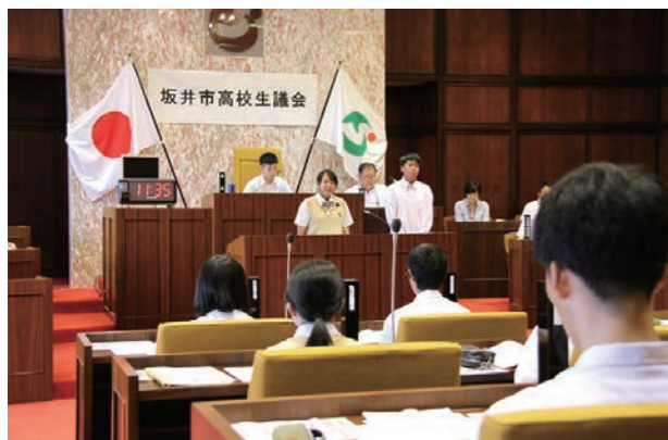
▲通常行われている議会さながらの一般質問をする高校生

市政や議会に興味を持ってもらい、地域への愛着や誇りを醸成することなどを目的として、坂井市議会が「坂井市高校生議会」を開催しました。市内の高校に通学している高校生20人が、議員となって高校生ならではの視点から、市内の道路整備やコミュニティバス、観光客の誘客などに関する質問を市長らに投げかけました。