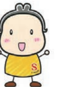
坂井市消費者センター マスコットキャラクター 「しっかりさん」

詳しくは、市ホームページ「坂井市消費者センター」をご覧ください。 申込方法 電話で下記へ ※無償の品物のみ取り扱います ※掲載期間は3カ月(自動継続はしません) ※掲載品は掲載者が保管 ☎市民生活課 ☎50-3030