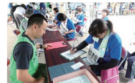
▲被災者の支援要望を聞き取る訓練を行う災害ボランティアセンター