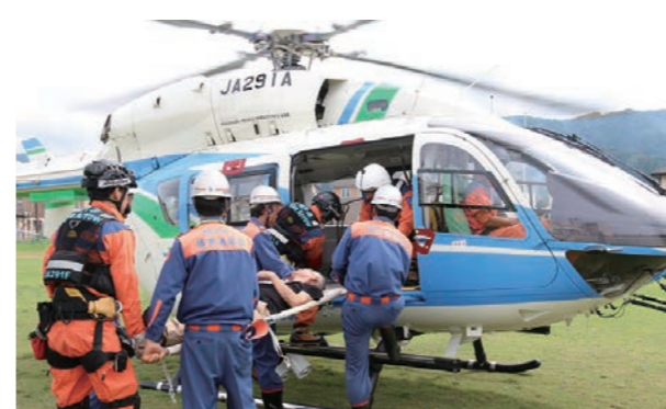
▲福井県の防災ヘリも参加し、重症患者の搬送訓練を実施した

大規模地震を想定した防災訓練を市内全域で行いました。防災訓練には市内全域で2万人以上が参加し、地域ごとに一時避難訓練などを実施。避難所の一つである長畝小学校では、避難所開設訓練や食料・飲料の配布などを行いました。また、市社会福祉協議会本部の駐車場では、災害ボランティアセンター設置・運営訓練も行われました。ボランティアセンター連絡会員など総勢87人が参加し、災害ボランティアの受け入れや、被災者の支援要望のマッチング、活動証明書の発行など有事の際の行動手順を確認しました。