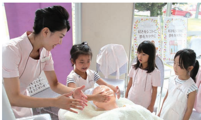
▲働くことの楽しさだけでなく、大変さも体験する子どもら

市内の小学生に働くことやお金の大切さを学んでもらおうと、「わく・ワク・WORK おしごとってなに？」がハートピア春江と春江中コミュニティセンターで行われました。市内を中心とした企業の協力による31の業種の体験コーナーを設置。小学生らは、興味のある業種を体験し、給料として得た会場内で使える専用のお金を使い、お買い物やアクションなどを楽しんでいました。