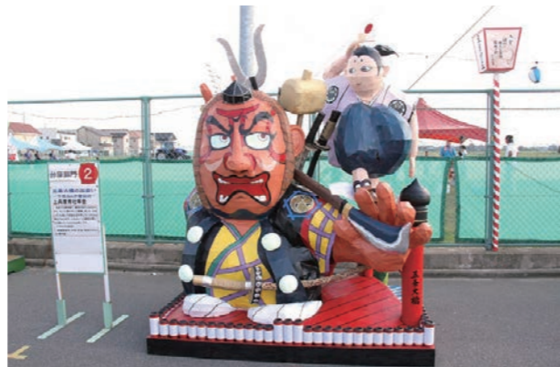
▲台座部門かがし大将に選ばれた上兵庫壮年会の「五条大橋の出会い〜牛若丸と弁慶伝説〜」

まちの話題が満載の「フォーカス」は、市のホームページ( http://www.city.fukui-sakai.lg.jp/ )からもご覧いただけます。ホームページでは「ホット」な話題を随時公開。また、上記以外の話題も紹介しています。