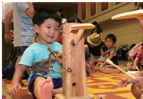
▲木の温かみを感じながら、楽しくあそぶ子どもら