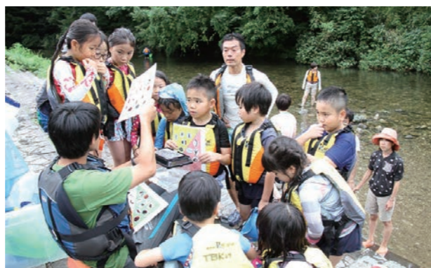
▲網を使って川で捕まえた、ドンコやオニヤンマのヤゴに興味津々の品川区の子どもら

2017さかい夏祭りが坂井グラウンド駐車場周辺にて行われました。「これまでも これからも 笑顔あふれる さかい」をテーマとしたかがしコンテストには、53体のかがしが集結。ステージイベントでは、三国高校書道部の作品発表を皮切りに、恒例となっている子どもKagashiダンサーなどの発表が行われ、フィナーレの花火では、会場から大きな歓声が上がりました。