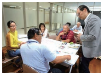
▲写真は昨年度の「まちカレ」の様子

第 2期まちづくりカレッジの受講生を募集します。まちづくり活動に必要な考え方や実践的な手法などについて、まちづくりに関心のある仲間と「講義」や「ワークショップ」「フィールドワーク」を通して学び合います。 とき 10月25日(水) 19時30分～21時 ※内容によって変更あり ※詳細は、各コミュニティセンターにある受講案内をご覧ください ところ 春江中コミュニティセン