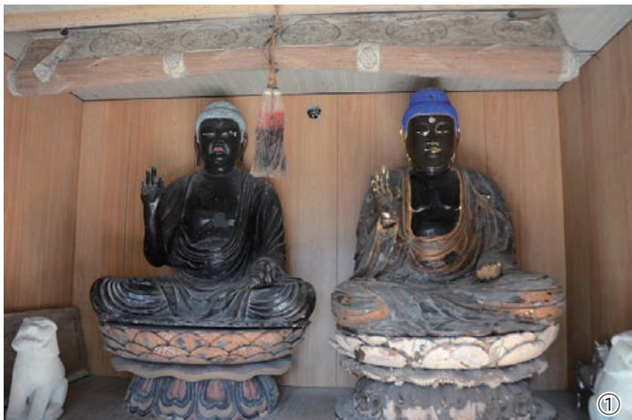
①黒仏で親しまれる阿弥陀如来坐像(左)と釈迦如来坐像(右) ②古文書の展示風景(今年2月のどんど焼きにて) ③織田信長禁制(禁止事項が定められた文書) ④古文書の展示風景(今年4月の春祭りにて) ⑤子どもたちによる玉串奉てん(今年4月の春祭りにて)