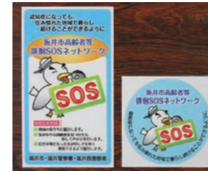
▲事業所登録証。店舗用(左)と自動車・バイク用(右)

■協力事業所を募集 徘徊SOSネットワークに賛同し、協力いただける事業所を随時募集しています。協力事業所は、普段の業務の範囲内で気がかりな高齢者を見守ったり、徘徊で方向不明になった高齢者などの捜索の協力をしていただきます。また、事業所登録証(ステッカー)をお渡しします。 ■事前登録・協力事業所の申し込み方法 健康長寿課(高齢福祉)までご連絡ください。マニュアル・申請書類を郵送します。また、市ホームページでも、マニュアル・申請書類がダウンロードできます。必要事項を記入の上、健康長寿課(高齢福祉)または各支所福祉グループに提出してください。