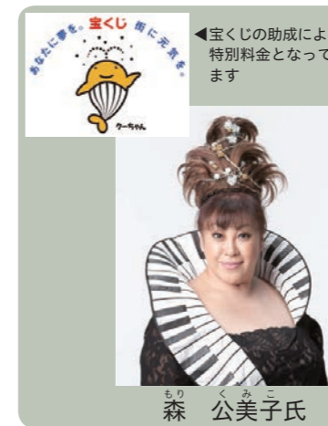
☎みくに文化未来館 ☎82-7200

みくに市民センターの開館を記念し、宝くじ文化公演「森公美子コンサート〜カモナ・マイ・ドリーム〜」を開催します。 とき 11月23日(木・祝) 16:00 ~ ところ みくに市民センター 料金 一般 2,000円 高校生以下 1,000円 ※9月17日(日)より販売開始。全席指定