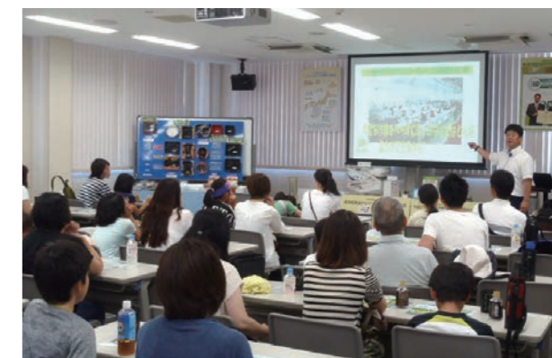
▲食品トレーのリサイクルの仕組みについて、真剣に話を聞く参加者