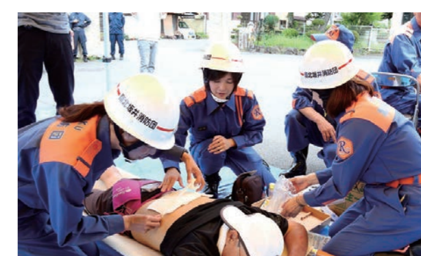
▲声掛けを行いながら、応急処置の訓練を行う坂井消防団