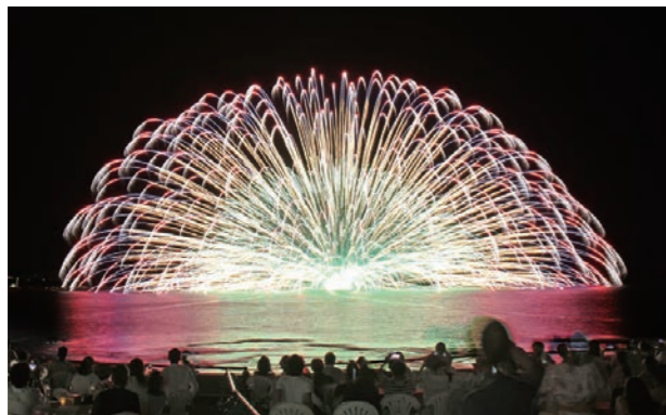
▲三国花火の一番の見どころである水中二尺玉に、会場中が魅了された

夏の夜空と水面を彩る三国花火大会が、三国サンセットビーチで行われました。天候にも恵まれた今大会は、県内外から多くの観客が訪れ、約10,000発の花火を堪能。三国花火の代名詞・水中二尺玉や大迫力の打ち上げ二尺玉、ワイドスターメインなどが打ちあがると、観客からは大きな拍手が沸き起こっていました。