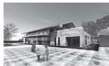
▲新三国駅舎のイメージ図