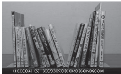
①②③④ ⑤ ⑥⑦⑧⑨⑩⑪⑫⑬⑭⑮⑯⑰⑱