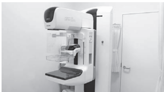
最先端技術を用いた3D撮影マンモグラフィ装置