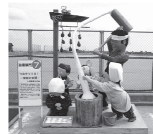
▲昨年のががし大将作品 「つながってる!~家族の気餅~」

深 めよう地域の絆をテーマに、さかい夏祭りを開催します。メインは恒例のかがしコンテストと昔懐かしい踊り。今年のががしのテーマ「心に残るみんなの思い出」には、計56体のががしが出展予定です。ステージ発表からフィナーレの花火まで、みんなが楽しめるイベントにお越しください。