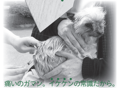
痛いガマン。イゲケン イゲケン の常識だから。