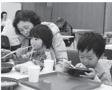
▲昨年の新そばまつりの様子